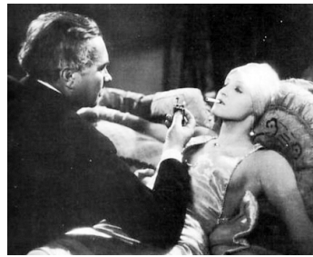
1928 LA MANDRAGORE (Alraune) d'Henrik Gaalen avec Brigitte Helm