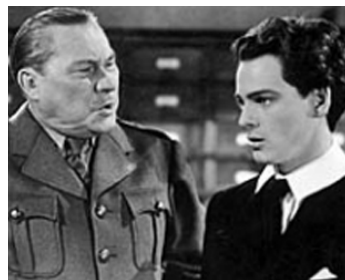
1940 MEIN LEBEN FÜR IRLAND de Max W. Kimmich avec Heinz Ohlsen