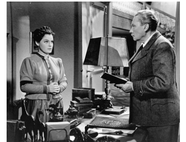
1939 LE DROIT À L'AMOUR (Das Recht auf Liebe) de Joe Stöckel avec Magda Schneider