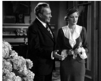
1935 UN HOMME À POIGNE (Der Mann mit der Pranke) de R. Van der Noss avec Rose Stradner