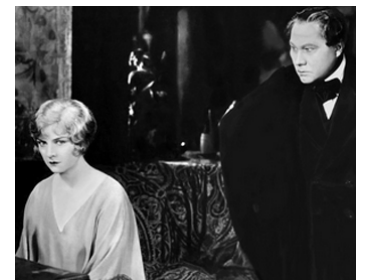
1926 LE MAGICIEN (The Magician) de Rex Ingram avec Alice Terry