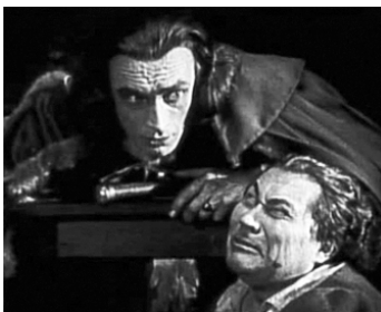
1922 LUCRÈCE BORGIA (Lucrezia Borgia) de Richard Oswald avec Conrad Veidt