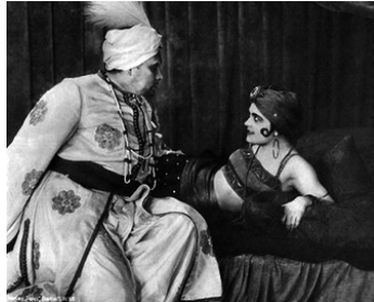
1920 SUMURUN (Sumurun) d'Ernst Lubitsch avec Pola Negri