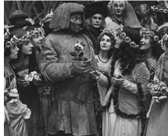
1920 LE GOLEM (Der Golem, wie er in die Welt kam) de Carl Boese avec Greta Schröder