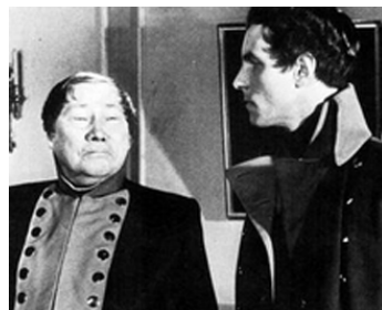
1944 LA CITADELLE DES HÉROS (Kolberg) de Veit Harlan avec Gustav Diessl