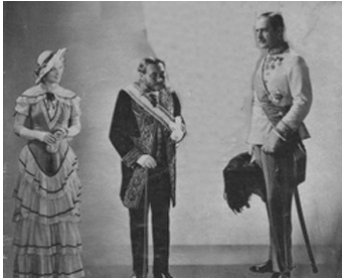
1932 AMOUR DE PRINCESSE (Das Geheimnis um Johann Orth) de Willi Wolff avec Ellen Richter