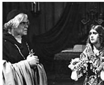
1922 MONNA VANNA de Richard Eichberg avec Lee Parry