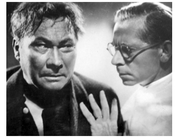
1932 HISTOIRES EXTRAORDINAIRES (Unheimliche Geschichten) de R. Oswald avec Paul Henckels