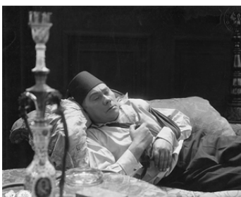
1926 DAGFIN LE SKIEUR (Dagfin, der Schneeschuhläufer) de Joe May