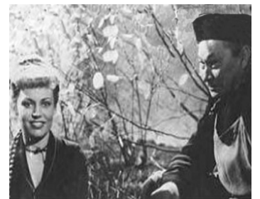
1948 LE GRAND MANDARIN (Der große Mandarin) de Karl-Heinz Stroux avec Carsta Löck