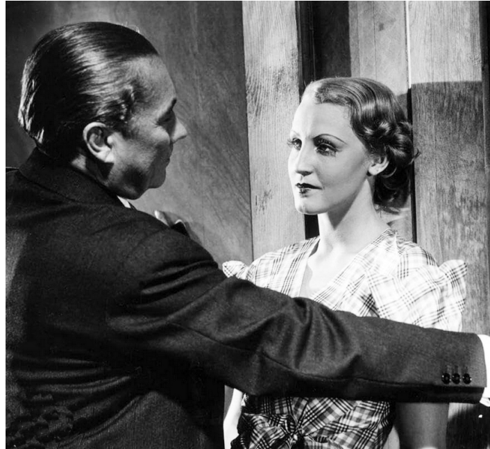
1933 INGE ET SES MILLIONS (Inge und die Millionen) d'Erich Engel avec Brigitte Helm