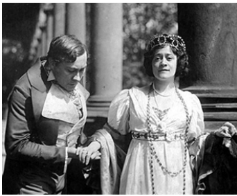
1913 L'ÉTUDIANT DE PRAGUE (Der Student von Prag) de Stellan Rye avec Grete Berger