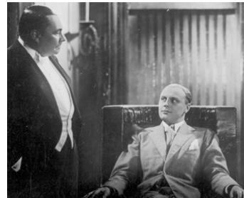
1922 LES MORTS-VIVANTS (Sterbende Völker) de Robert Reinert avec Harald Paulsen