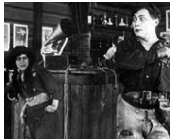
1913 EVINRUDE (Evinrude, Die Geschichte eines Abenteurers) de Stellan Rye avec Grete Berger