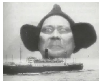
1924 LES BOUDDHAS VIVANTS (Lebende Buddhas) de Paul Wegener