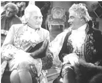
1935 JUSTE UN COMÉDIEN (...nur ein Komodiänt) d'Erich Engel avec Rudolf Forster