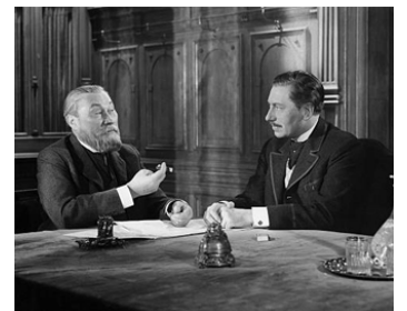
1942 DIÉSEL (Diesel) de Gerhardt Lamprecht avec Willy Birgel