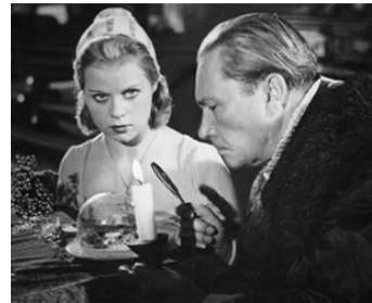
1939 LE CŒUR IMMORTEL (Das unsterbliche Herz) de Veit Harlan avec Kristina Söderbaum