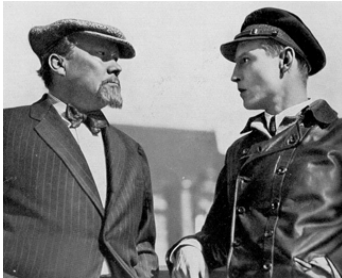
1933 HANS WESTMAR (Hans Westmar, Einer von Vielen) de Franz Wenzler avec Emil Lohkamp