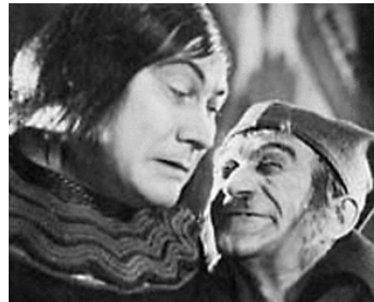
1921 LA FIN DU DUC DE FERRANTE (Herzog Ferrantes Ende) de Paul Wegener & R. Gliese