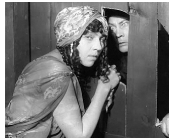
1916 LE YOGI (Der Yoghi) de Paul Wegener & Rochus Gliese avec Lyda Salmonova