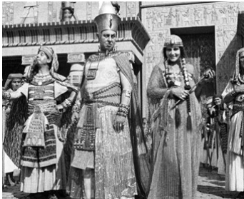
1921 LA FEMME DU PHARAON (Das Weib des Pharaos) d'Ernst Lubitsch avec Lyda Salmonova