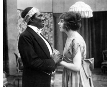
1918 DER FREMDE FÜRST de Paul Wegener avec Lyda Salmonova