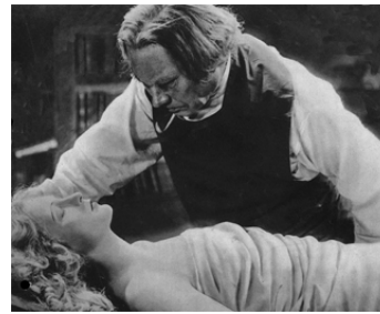
1930 LES PIRATES DE LA GRANDE VILLE (Fundvogel) de W. H. Harnisch avec Camilla Horn