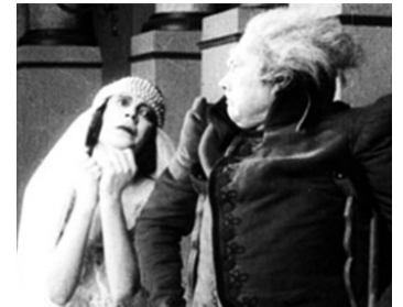
1922 LA NOCE AU PIED DE LA POTENCE (Vanina) d'Arthur von Gerlach avec Asta Nielsen