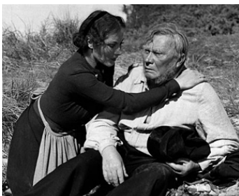
1940 LA TEMPÊTE (Das Mädchen von Fanö) d'Hans Schweikart avec Brigitte Horney