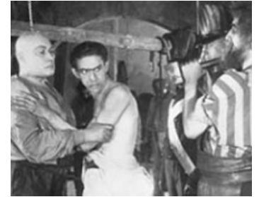
1919 LE GALÉRIEN (Der Galeenesträfling) de Rochus Gliese avec Ernst Deutsch