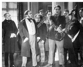
1926 LES TISSERANDS (Die Weber) de Frederic Zelnik avec Wilhelm Dieterle