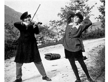
1920 L'OMBRE PERDUE (Der verlorene Schatten) de Rochus Gliese avec Lyda Salmonova