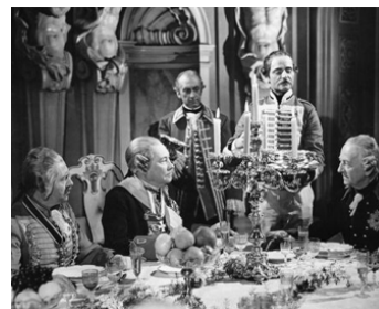
1942 LE GRAND ROI (Der große König) de Veit Harlan avec Otto Wernicke