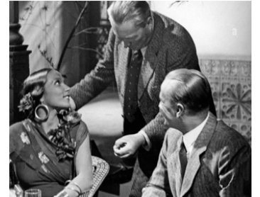
1934 UN HOMME VEUT L'ALLEMAGNE de Paul Wegener avec Brigitte Horney, Karl L. Diehl